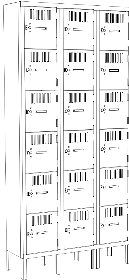
ARMARIOS DE 6 ESPACIOS, 3 UNIDADES DE ANCHO, CON PATAS